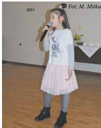
Fot: M. Mitka