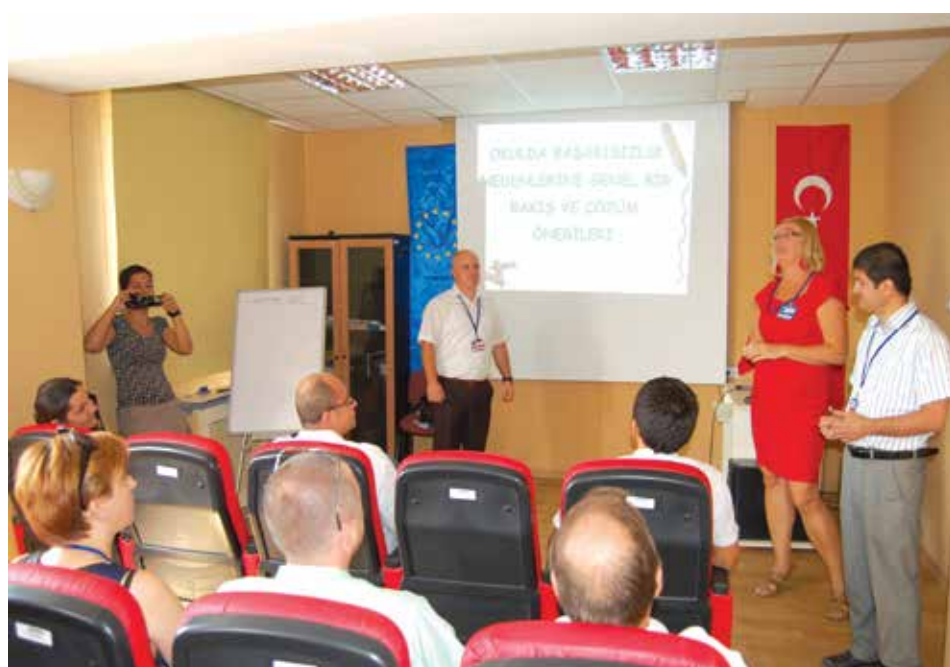
Seminarium Zapobieganie niepowodzeniom szkolnym.