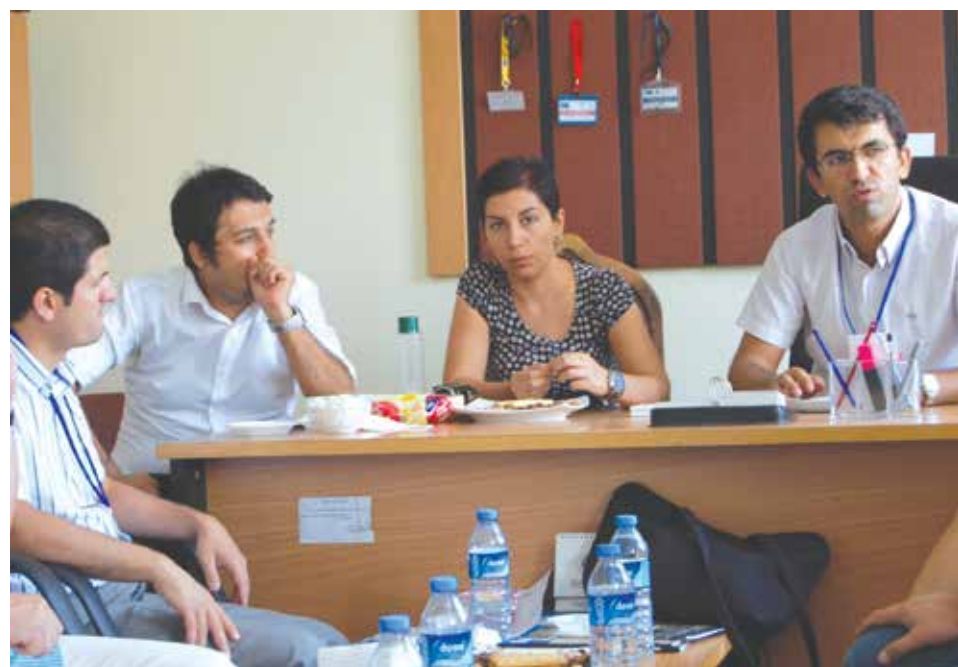
Spotkanie seminaryjne w Liceum Ogólnokształcącym.