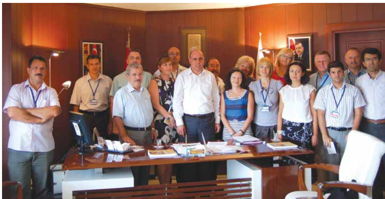
Wizyta u Burmistrza Mardinu