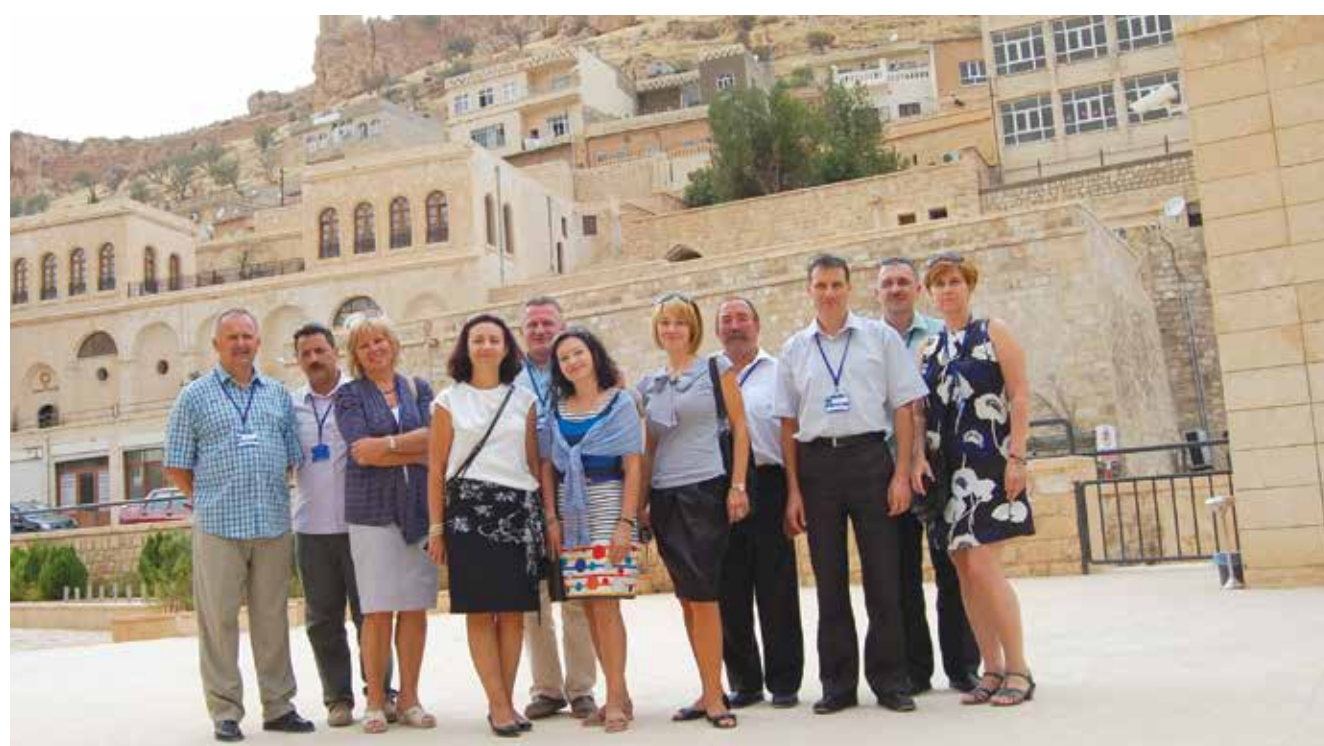
Delegacja polska na tle „starego miasta” Mardin.