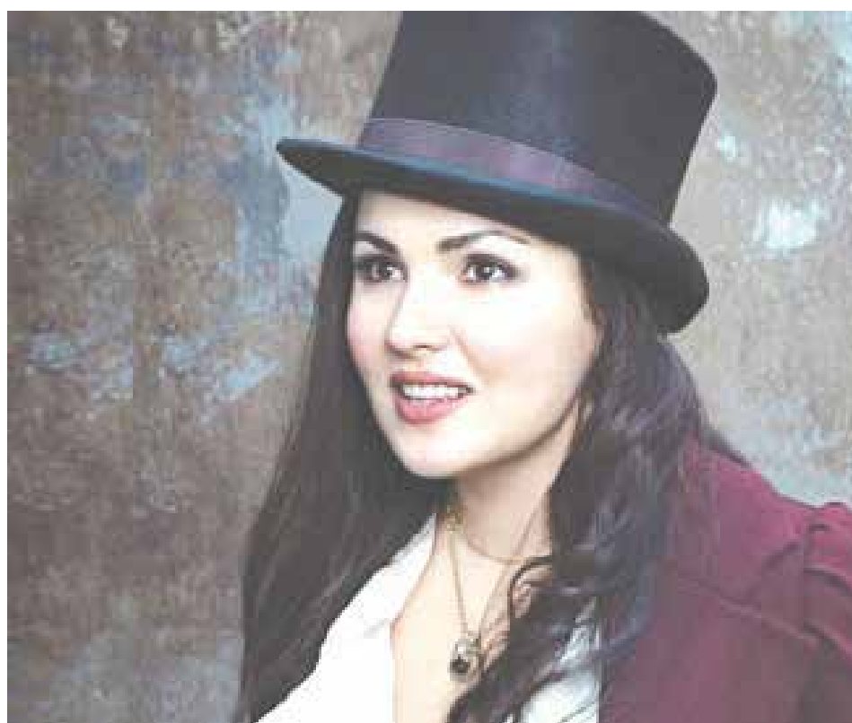
Na zdjęciu Anna Netrebko (Adina) w przedstawieniu Napój miłosny.

Do wsi przybywa Dulcamara, wędrowny medyk, sprzedający lekarstwa na wszystkie dolegliwości i choroby. Nemorino nieśmiało pyta, czy ma on także napój miłosny opisany w książce Adiny. Medyk porwiera i wyciąga butelkę bordeaux. Nemorino kupuje za ostatniego dukata butelkę i natychmiast wypija jej zawartość, a Dulcamara wyjaśnia, że na efekt działania cudownego napoju trzeba będzie poczekać do następnego dnia (w tym czasie Dulcamara zniknie). Kiedy pojawia się Adina, Nemorino zaczyna odczuwać efekt działania „eliksiru”. Pewien, że następnego dnia napój zadziała, udaje obojętność. Aby go ukarać, Adina flirtuje z Belcore. Tymczasem sierżant otrzymuje rozkaz powrotu do garnizonu, wobec czego Adina zgadza się, by ślub odbył się natychmiast. Nemorino błaga, by poczekała jeszcze jeden dzień, ale ona odrzuca jego prośby i zaprasza na uroczystość całą wieś. Zrozpaczony Nemorino błaga Dulcamarę o pomoc, prosi o kolejną butelkę eliksiru. Ponieważ nie ma już pieniędzy, medyk zgadza się czekać w karczmie, by Nemorino mógł pożyczyć od kogoś potrzebną kwotę.