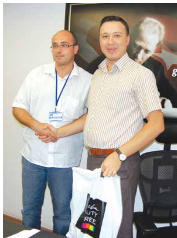
Podziękowanie dla wicegubernatora prowincji Mardin